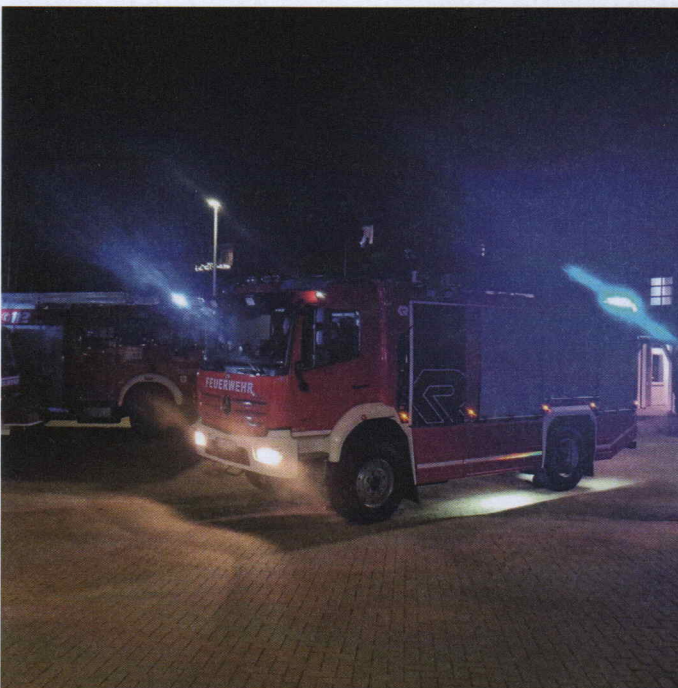
Das neue Ellerbeker Feuerwehrfahrzeug HLF 10.

Wegen Corona fand die Veranstaltung weitestgehend im Freien statt.